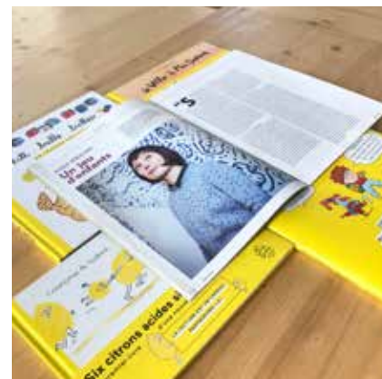
magazine Bretons, mars 2022

À chaque album (le quatrième maintenant) des rires ! Pour la jeune maison Six citrons acides éditions qui a choisi de mettre la langue à l'honneur en dédramatisant à fond ses bizarreries, Mes quatre zamis de @vehlmannfabien et @charles_duterte sont une nouvelle réussite !