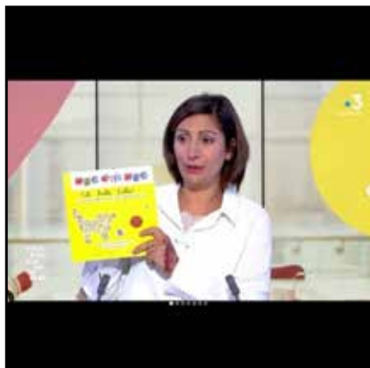
émission Vous êtes formidables, France 3 Pays de la Loire

Petit exercice de style avec ce drôle d'album proposé par la nouvelle maison d'édition Six Citrons acides , engagée pour une langue française vivante.