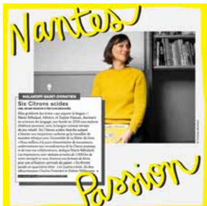
magazine Nantes Passion, février 2022

petits et grands lecteurs, autrices et auteurs, libraires, médiathécaires et toute la foule de pros et de cœur qui font vivre le livre.